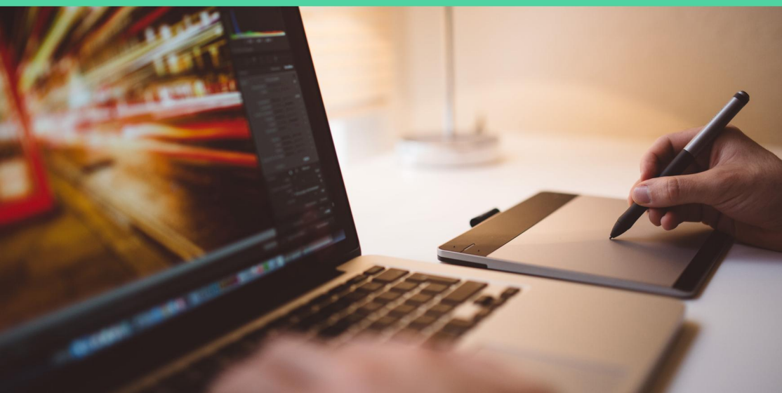
CRIAÇÃO DE ARTE, EDIÇÃO E FINALIZAÇÃO