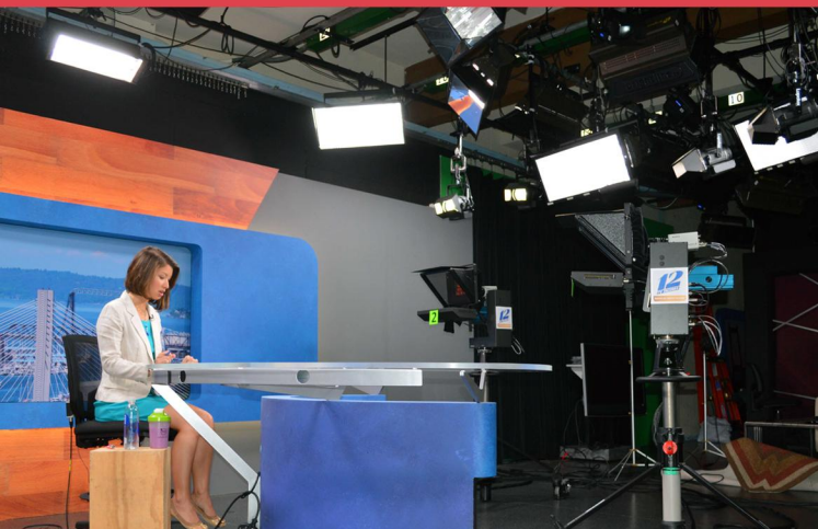
CANAIS E PROGRAMAS