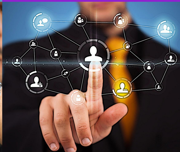
PUBLICAÇÃO SISTEMÁTICA EM REDES SOCIAIS