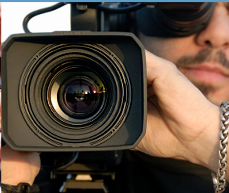
CLIPES E FILMES INSTITUCIONAIS