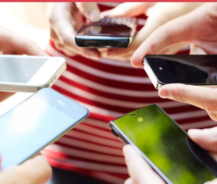
LANÇAMENTOS DE SERVIÇOS E PRODUTOS