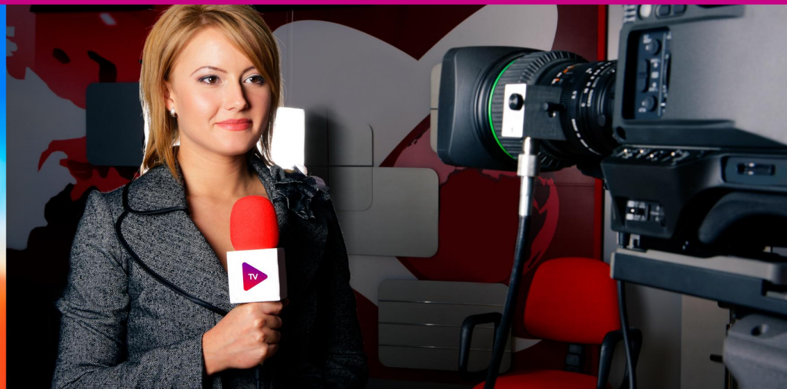
REPÓRTERES, JORNALISTAS E PRODUTORES