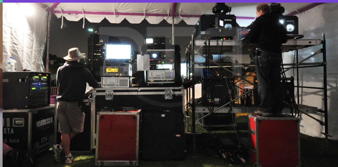
ESTÚDIO E EQUIPAMENTOS